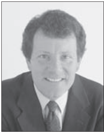
NICHOLAS D. KRISTOF © 2012 New York Times

WHITECLAY, Neb. – After seeing Anheuser-Busch's devastating exploitation of American Indians, I'm done with its beer.